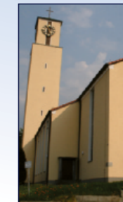
Kath. Herz-Jesu Kirche Am Kirchberg 7, Varnhalt