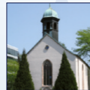
Alt-katholische Spitalkirche bei der Caracalla-Therme, Innenstadt