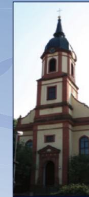
St. Bartholomäus Haueneberstein

18:00 Spielraum – öffnet Türen 19.00–21.00 Self-Guided Kirchenführung