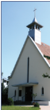
Evang. Friedensgemeinde Schwarzwaldstr. 131, Baden-Oos