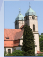
Evang. Lutherkirche Hauptstr. 51, Lichtental

19.30–20.00 Lieder und Texte zum Thema: Methodism was born in song – Der Methodismus wurde aus dem Lied geboren