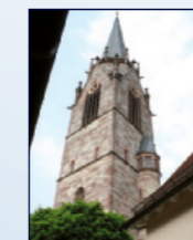
Kath. Kirche St. Jakobus Häfnergasse 16, Steinbach

20:00 Bibelworte – Stille – gute Gedanken