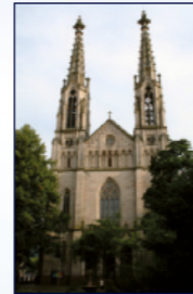
Evang. Stadtkirche Augustaplatz, Innenstadt

18:30 Klänge zum Ankommen und Verweilen Ausgewählte Bilder a. d. Tübinger Bibel v. Sieger Köder