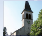
Kath. Kirche St. Eucharius, Balger Hauptstr. 57a, Balg

18:30 Klänge zum Ankommen und Verweilen Ausgewählte Bilder a. d. Tübinger Bibel v. Sieger Köder