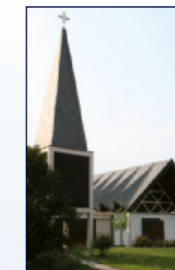
Evang. Matthäuskirche Steinbacher Str. 10, Steinbach