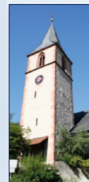
Kath. Kirche St. Antonius Ebersteinburger Str. 52, Ebersteinburg

Öffnen Sie die Türen für die Kraft moderner geistlicher und weltlicher Musik, interpretiert durch die Jugend-Kirchenband „Spielraum“, Eröffnen Sie „Gedanken-Spielräume“, bei ergänzenden Impulsen und Texten des Gemeindeteams St. Antonius. Entdecken Sie danach bei einer selbstgeführten Kirchentour die historischen und modernen Kunstschätze unserer Kirche (Smartphone empfohlen aber nicht zwingend erforderlich)