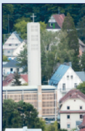
Evang. Pauluskirche Jagdhausstr. 18, Weststadt

Paulus leuchtet 19.00–20.30 Uhr Turmbeleuchtung im Freien und Bilderausstellung der KonfirmandInnen zum Thema in der Kirche 19.00–19.30 und 20.00–20.30 Uhr Lesungen zum Thema musikalische Gestaltung: Ulrike Krone, Harfe