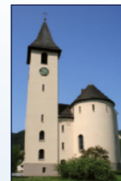
Kath. Kirche Heilig Geist Bushaltestelle Heschmattweg, Geroldsau

18.30 Eucharistiefeier anschließend bis 21.00 Besinn-Dich-Pfad Das Angebot ist besonders auch für Familien geeignet