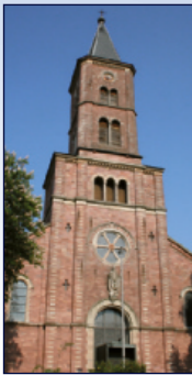
Kath. Kirche St. Dionys Oos Ooser Kirchstr. 1, Baden-Oos

Die Bibelgeschichten in Bildern mit Legematerial von Kindergartenkindern gestaltet. 19:30 / 20:30 Uhr: Die Bibelgeschichten werden vorgelesen mit den Bildern von den Kindern und musikalisch umrahmt (ca. 20 min). In den „Zwischenzeiten“ gibt es das Stille Angebot die Bibelgeschichten in Bildern sich selbst zu erschließen in besinnlicher Atmosphäre.