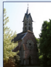
Evang.-luth. Johanniskirche Bertholdstr. 5, Stadtmitte

18.00 Spiritueller Rundgang durch die Bilderwelt unserer Kirchenfenster (ca. 45 min.) 20.00 Eintauchen in die lichtvolle Atmosphäre des Taizé-Gebets (ca. 45 min.)