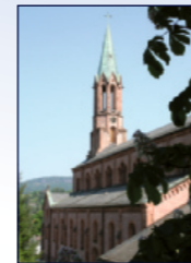
Kath. Kirche St. Bonifatius Kirchweg 7, Lichtental

18:30 Abendandacht mit den Beatles Lesungen und Musik für Viola da gamba vom Barock bis zu den Beatles