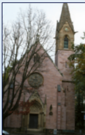
Kath. Dreieichenkapelle Rheinstr. 64, Weststadt