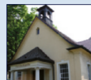
Evang.-methodistische Christuskapelle Lichtentaler Str. 77a, Eingang Hahnhofstr., Innenstadt